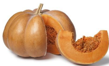
Kürbis Muscat (France) CHF/Kg 1.10