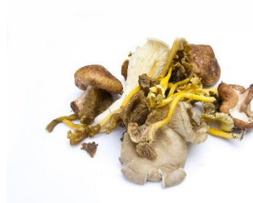
Mischpilze (Divers) CHF/Kg 14.90